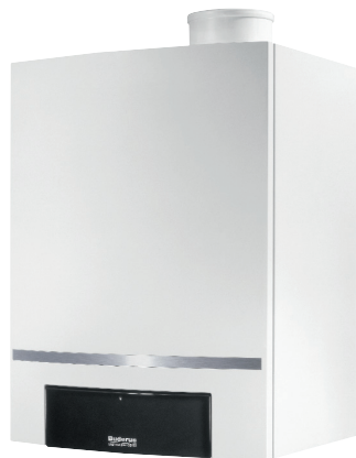
Logamax plus GB 162 [ 15 - 45 kW ]