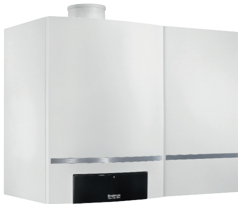
Logamax plus GB 162-30T40S