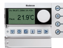
Logamatic RC35 EMS időjárásfüggő szabályozó