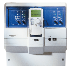
Logamatic 4121 időjárásfüggő szabályozó